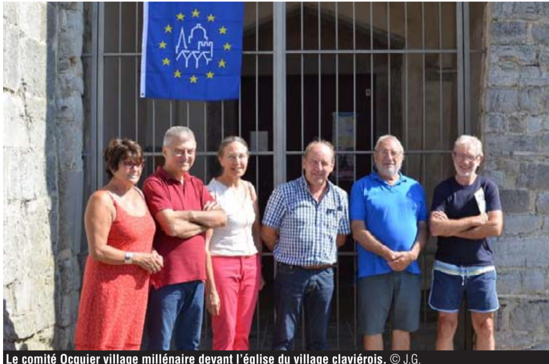
Le comité Ocquier village millénaire devant l'église du village claviérois.